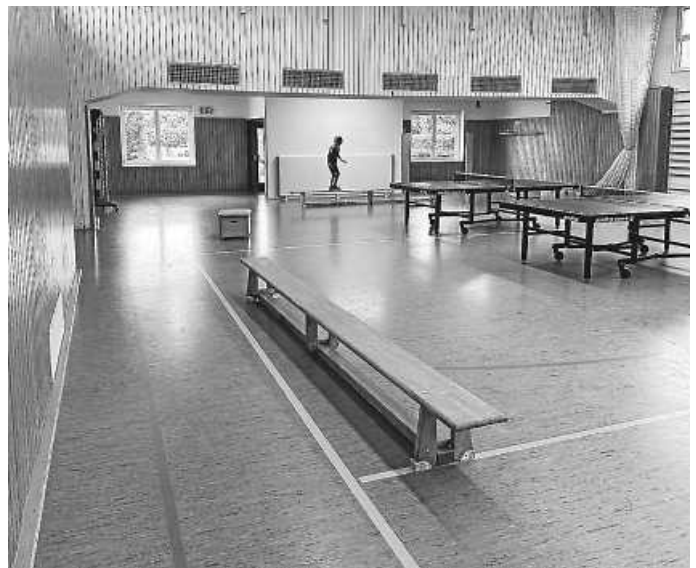
Allein auf weitem Parcours jonglieren