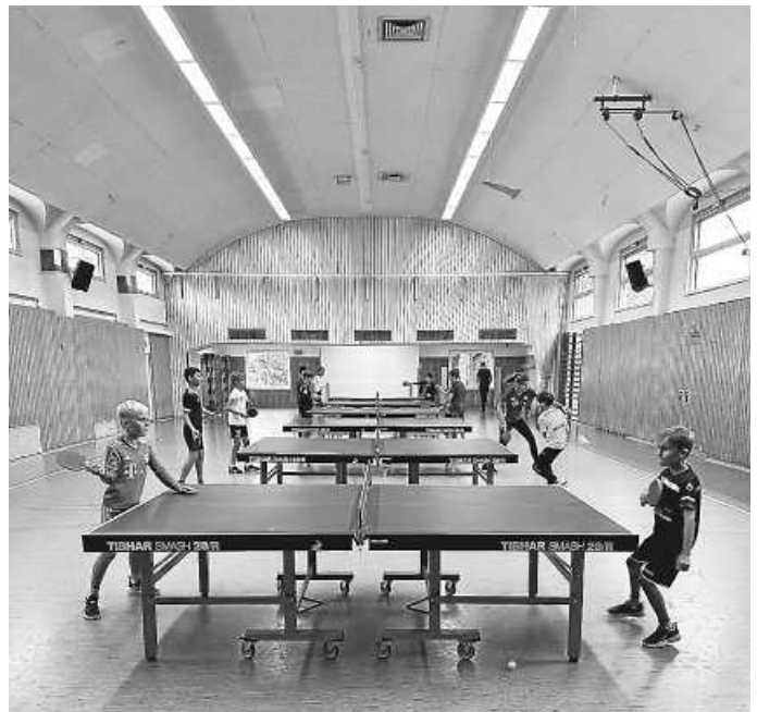
Wettbewerbsstimmung während des „Kaiserspiels“

Nach einer Halbzeitpause, bei der es Getränke und jeweils ein Eis zum Verkosten gab, ging es in der zweiten Hälfte wettbewerbsmäßig weiter. Zunächst wurde an 6 Tischtennisplatten das sogenannte „Kaiserspiel“ durchgeführt. Hier standen sich an jeder Platte 2 Teilnehmer gegenüber, die Tischtennis für ca. 3 Minuten spielten. Nach Ablauf dieser Zeit konnte der Sieger eine TT-Platte nach oben rücken, während der Verlierer eine TT-Platte nach unten wechselte. Hier wurde mit Eifer um jeden Ball bzw. Punkt gekämpft und dementsprechend laut ging es in der Halle zu. Zum Abschluss der Veranstaltung folgte der sogenannte „Rundlauf“. Hier standen an 2 Tischtennisplatten jeweils 7 Teilnehmer, die nach jedem durchgeführten Schlag die Plattenseiten wechseln mussten. Wurde ein Ball verschlagen, so bedeutete dies das Ausscheiden. Die beiden letzten Teilnehmer rangen im Finale um Wertungspunkte und nach diesem Entscheid ging es für die Teilnehmer von vorne los. Auch hier ging es dementsprechend laut zu. Nach 2,5 Stunden wurde die Veranstaltung mit dem Aushängen einer Teilnahmebescheinigung/-urkunde und einem Abschlussfoto beendet. Den teilnehmenden Kindern und den beiden Übungsleitern hatte es ordentlich Spaß gemacht und der TTVZ freut sich schon darauf, im kommenden Jahr wieder Interessierte begrüßen zu dürfen.