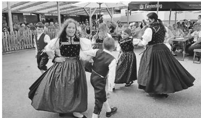
Kinder- und Jugendgruppe