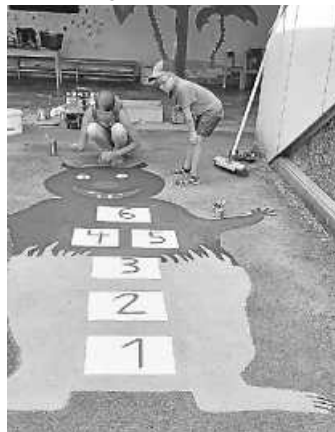
Das „Hüpfkästchenmonster“ am Eingang des Kindergartens.

Im Vorfeld haben die Kinder zusammen mit ihren Erzieherinnen abgestimmt, welches die 3 besten Motive sind. Die Wahl fiel dabei auf „3 gewinnt“, „Hüpfkästchen-Monster“ und „Farbspiegel“.