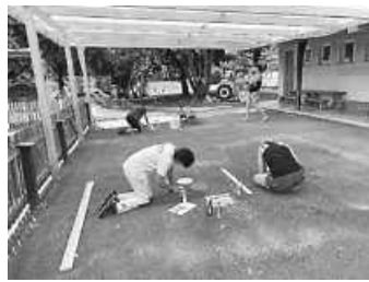
Die Eltern beim Malen und Gestalten der Hüpfspiele.