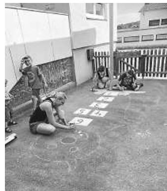
Das „Hüpfkästchenmonster“ bekommt Form und Farbe ...

Die Erzieherinnen überraschten uns Malerinnen zwischen durch mit Kaffee, kühlen Getränken und Vesper. So ging die Arbeit noch leichter von der Hand. Vielen Dank für diese leckere Überraschung.