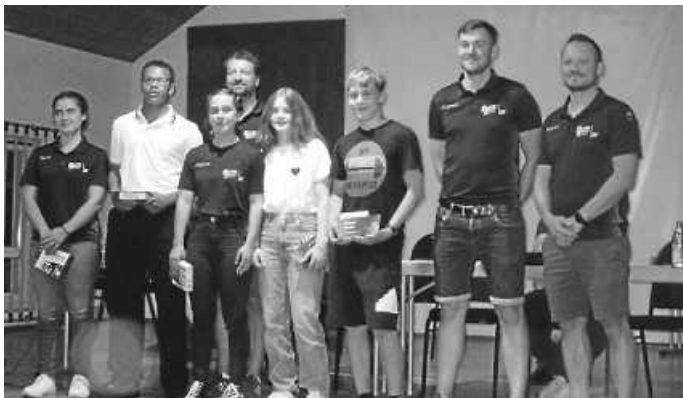
Aktive Jugendliche mit Jugendtrainern