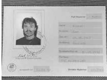
Spielerpass des Neuzugangs von 1992