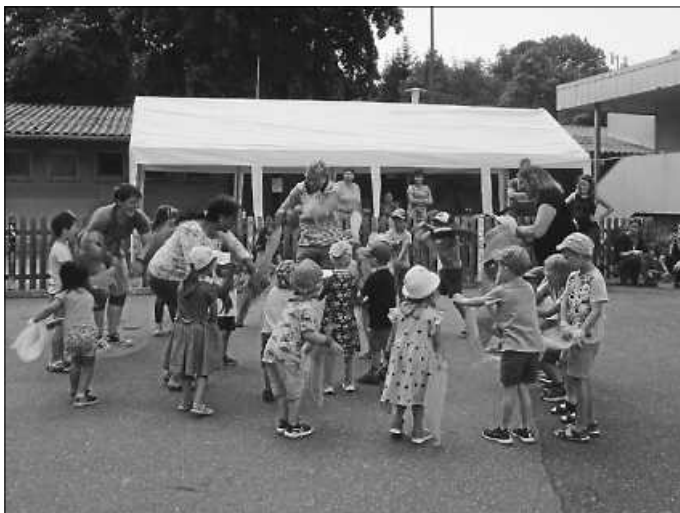
Die Kinder führen den Fischetanz vor.

Bei unserem diesjährigen Sommerfest konnten die Kinder mit ihren Familien einen schönen Nachmittag rund um den Kindergarten erleben. Da die Kinder sich aktuell mit dem Thema Wasser beschäftigen, drehte sich auch am Fest alles rund um dieses besondere Element. Zu Beginn verwandelten sich die Kinder in Fische mit bunten Flossen und führten mit den Erzieherinnen einen „Fischetanz“ auf.