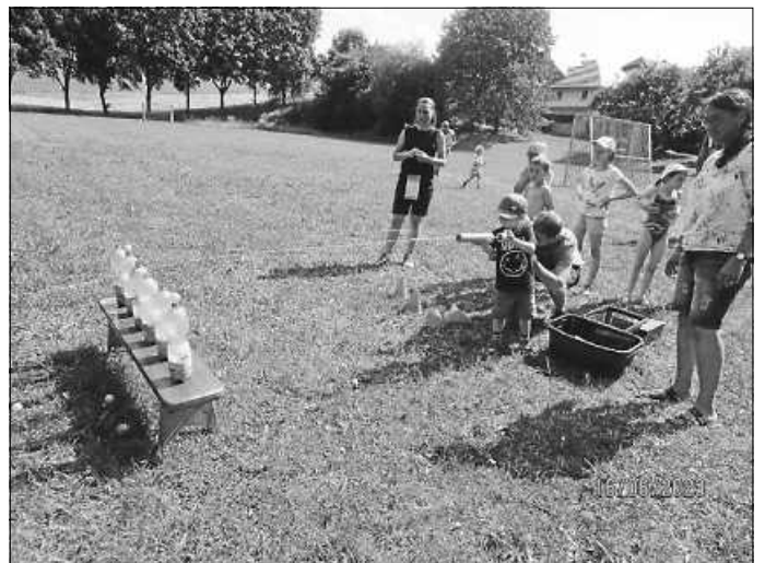
An dieser Station musste man viel Geschick beweisen.