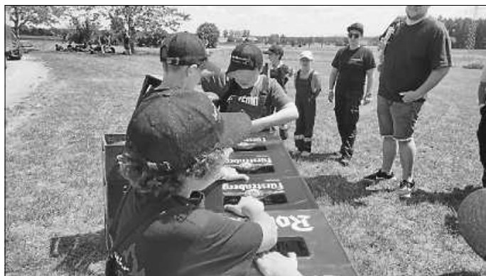
Bei der Lagerolympiade

Gemeinsam bauten wir unsere Zelte auf und richteten uns heimisch ein auf dem Hardt. Das Highlight war dann am Samstag die anstehende Lagerolympiade. Bei der wir von rund 40 Gruppen den 4., 25. und 36. Platz belegten. Unsere Freunde aus Rottweil schafften es, sich den Sieg und den begehrten Pokal des ersten Platzes an sich zu reißen. Dazu nochmals herzlichen Glückwunsch!