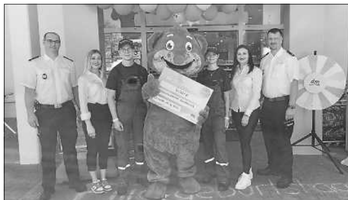
Bei der Scheckübergabe