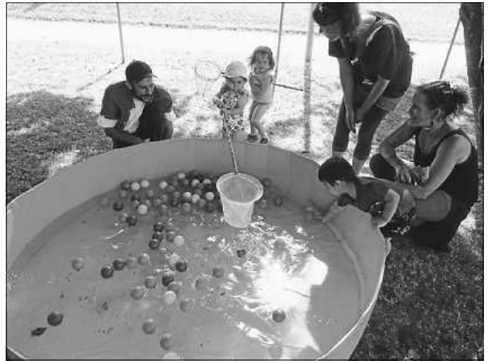
Die Kinder angeln mit ihren Eltern die Entchen.

Des Weiteren erwarteten die Kinder mit ihren Familien verschiedene Stationen, an denen es bestimmte Herausforderungen zu bewältigen gab. Die Kinder mussten mit ihren Eltern und Geschwistern Entchen angeln, Wasser über verschiedene Hürden transportieren, Bälle mit Wasserpistolen abschießen und einen Wassertransport mit Schwämmen meistern. Als Belohnung bekam jede Familie einen Stempel auf eine Laufkarte.