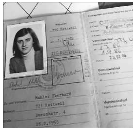
Spielerpass aus dem Jahre 1975

Für sein Engagement bekam er zudem die Spielernadel in Gold für 50-jähriges aktives Tischtennispielen.