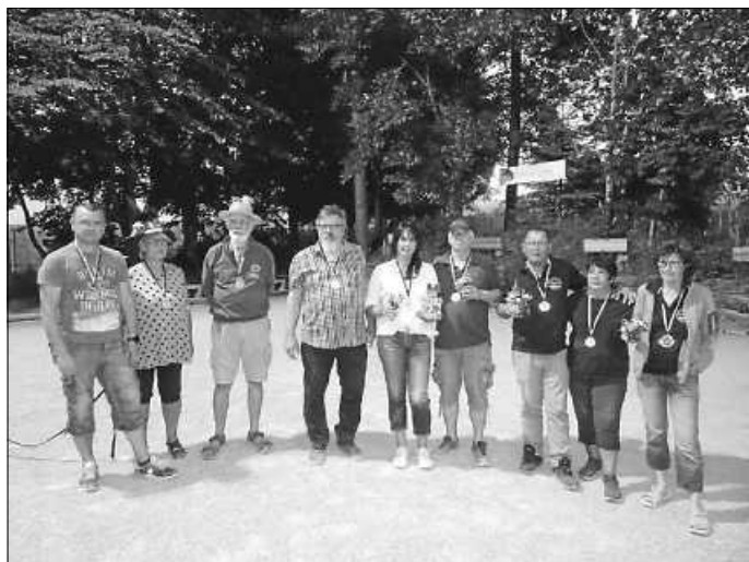
Wie bei gedachtem Podest: Sieger in der Mitte, die Zweiten links, die Dritten rechts davon (aus Sicht der Sieger)