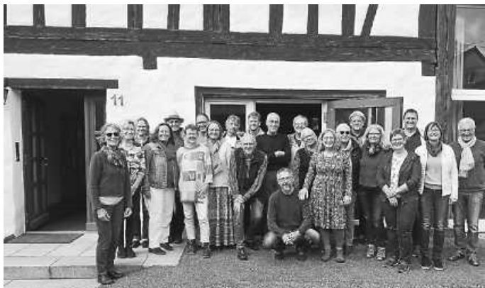
Wohnprojektgruppe bei Klausur in Horgen

Bitte nehmen Sie Kontakt mit uns auf. Dieses wichtige Projekt können wir nur gemeinsam verwirklichen!