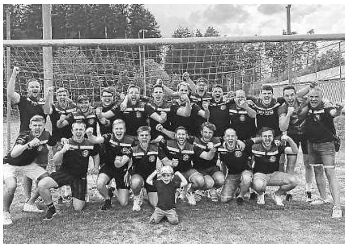
Unsere erfolgreiche Meisterschaft