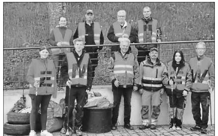
Die fleißigen Helfer der Dorfputzete

Dieses Jahr durften zur jährlichen Dorfputzete wieder die Musikerinnen und Musiker ran! Am Samstag, 13.05. wurde fleißig jeder Winkel von Flözlingen abgesehen und der Müll eingesammelt. Die Dorfputzete war also ein voller Erfolg!