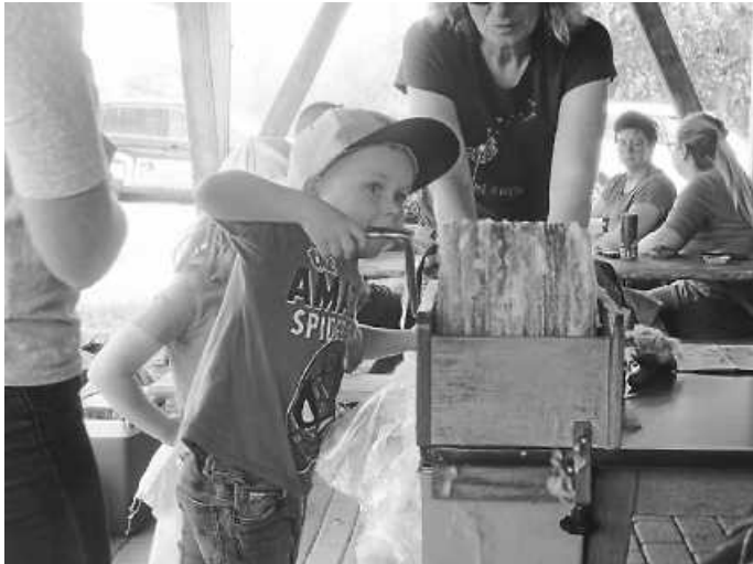
Kardieren der Wollfüllung

viel Kraft man aufwenden muss, um die Walzen der Kardiermaschine mit der Handkurbel zu drehen.