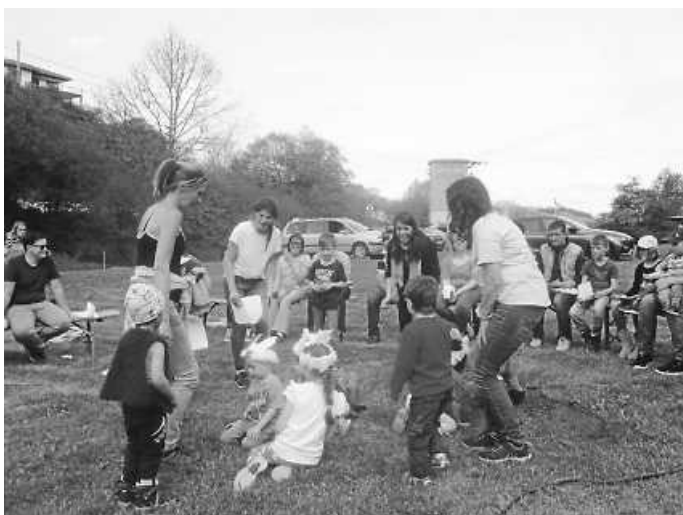
Der Hirtentanz innerhalb des Gottesdienstes

Wir hörten und sahen die Geschichte vom verlorenen Schaf. Am Ende des Gottesdienstes bekam jeder Teilnehmer noch einen Segenskeks mit auf den Nachhauseweg.