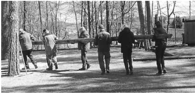
Gefragt: Kraft und bei den neuen Spielfeld-Maßen Exaktheit