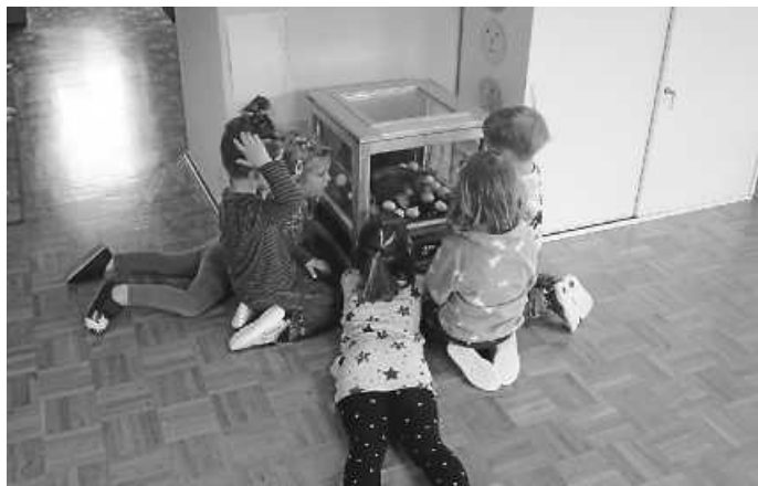
Die Kinder bestaunen den Schaubrutkasten und beobachten die Küken beim Schlüpfen

Etwa drei Wochen vor Ostern hat sich der Kindergarten vom Geflügelzuchtverein Schramberg einen Schaubrutkasten ausgeliehen. Hier konnten die Kinder beobachten, wie sich ein Küken im Ei innerhalb von 21 Tagen entwickelt und schlüpft. Kurz nach den Ostertagen sind die Küken bei uns im Kindergarten geschlüpft und die Freude war bei den Kindern sehr groß. Jeden Tag schauten die Erzieherinnen gemeinsam mit den Kindern nach den Eiern und füllten das Wasser im Brüter auf. Mit einer selbstgebastelten Liste von den Kindern, wurde jeden Tag ein Hähnchen gesetzt. So konnten die Kinder zählen und sehen, wie lange es noch dauert bis die Küken schlüpfen.