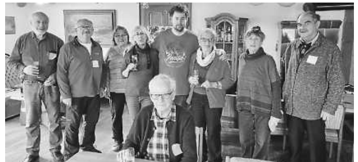
Die ersten Gäste beim Start des Spielenachmittags im ehemaligen Gasthaus Sonne in der Niedereschacher Straße 18 in Horgen.