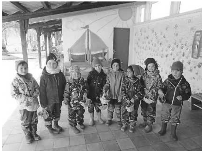
Der Osterhase hat für jedes Kind ein Osternestchen versteckt

An Gründonnerstag hat uns der Osterhase im Kindergarten besucht. Dabei hat er die bunten Nestchen überall in unserem Garten versteckt. Die Befüllung, hat wie in den Jahren zuvor, die Firma Betten Prinz aus Zimmern übernommen. Hierfür wollen wir uns noch einmal recht herzlich bedanken.