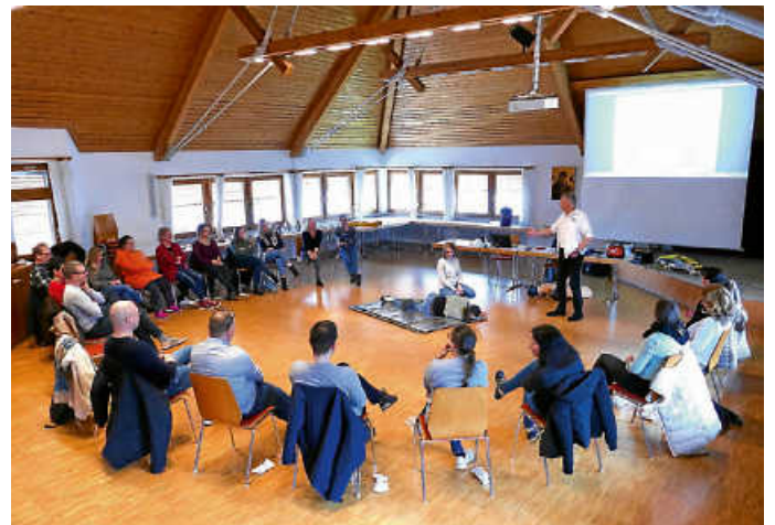
Rathaus-Team bei der Theorieschulung im Johannessaal

Hierbei erneuerten die Mitarbeiterinnen und Mitarbeiter ihre Kenntnisse und nutzten rege die Materialien und Testfiguren für die Umsetzung des Gelernten in der Praxis.