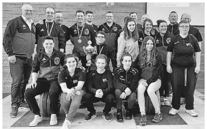
Teilnehmer mit Betreuer und Helfer vor und hinter der Hantel