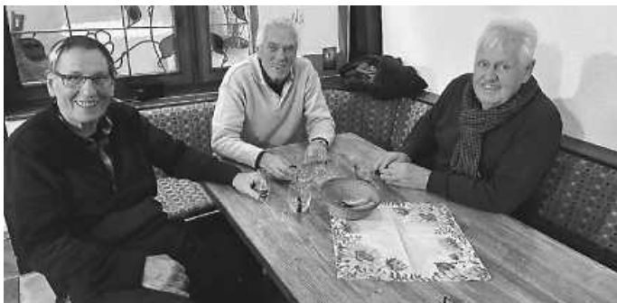
Frühere Arbeitskollegen treffen sich im SVZ-Sportheim

Unser Sportheim ist am Samstag ab 15 Uhr zur Fußball-Bundesliga geöffnet. Um 17 Uhr spielt die 1. Mannschaft gegen Reutlingen und um 18.30 Uhr steigt das Bundesliga-Topspiel FC Bayern München gegen Borussia Dortmund -live auf Sky- Nächste Woche: Dienstag & Mittwoch zum DFB-Pokal: Sportheim ab 18 Uhr geöffnet (u.a. Nürnberg – Stuttgart am Mittwoch, 18 Uhr!) Wir freuen uns über zahlreichen Besuch.