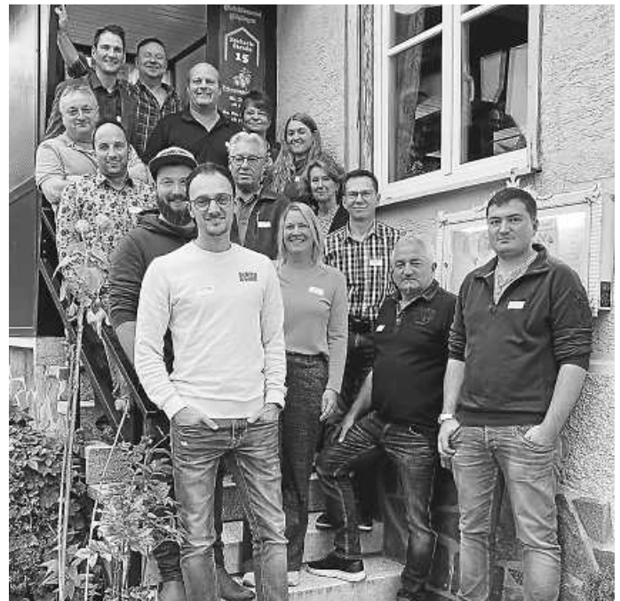
Die Teilnehmerinnen und Teilnehmer des zweiten Unternehmerstammtischs

Nach zweijähriger Corona-Pause hat die Gemeinde Zimmern o.R. am 13.10. zum zweiten Zimmerner Unternehmerstammtisch in den Brauereigasthof Hirsch nach Zimmern-Flözlingen geladen.