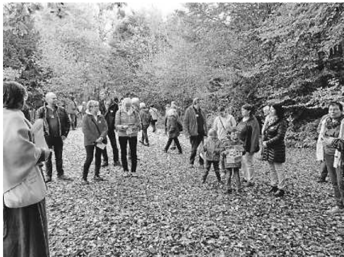
VDK auf dem Campus Galli

aus zeitlichen Gründen gestrichen. Der Abschluss fand dann im Gasthaus Kreuz in Neuhausen mit dem Abendessen statt. Hier ist zu bemerken, dass es ein gelungener kulinarischer und natürlich unterhaltsamer Abschluss war, bei welchem die Wirtin zur Hochform auflief.