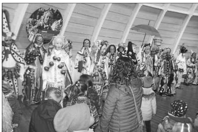
Besuch im Narrenschopf

Auch führte eine Exkursion die Vorschüler nach Bad Dürkheim in den Narrenschopf. Dort konnten viele heimische Narrenfiguren, sogar auch europäische Figuren bestaunt werden.