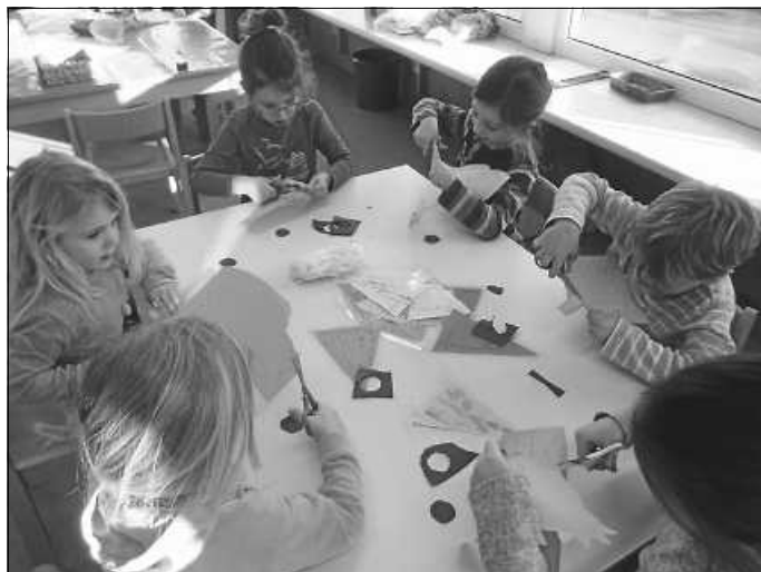
Basteln für Fasnet

In der Kita Stetten laufen seit Anfang Februar erste Vorbereitungen auf die Fasnet.