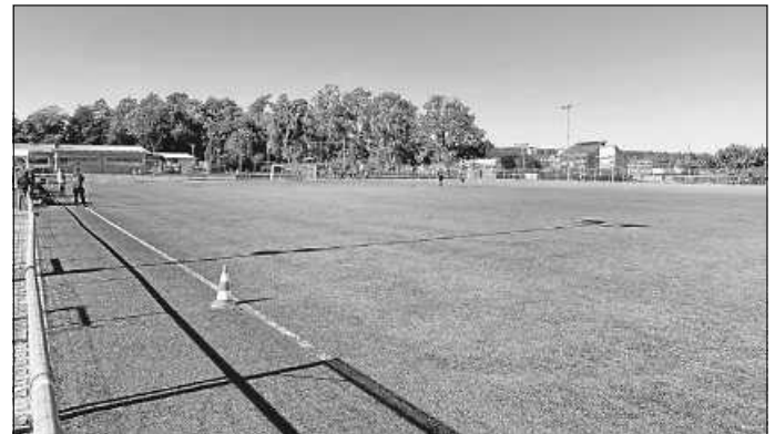
1. Testspiel 2022 auf dem Kunstrasenplatz