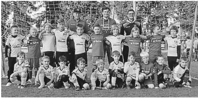
Jugendspieler des SVZ und des SVH vereint beim Freitagstraining auf dem Kapf.

Hoffentlich kann die neue Sporthalle so bald wie möglich gebaut werden, damit auch das Wintertraining gemeinsam stattfinden kann!