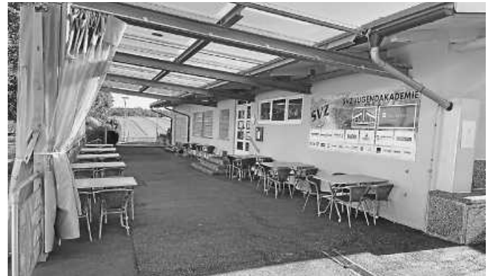
Sporthalle ist weiterhin geöffnet

Hoffentlich kann die neue Sporthalle so bald wie möglich gebaut werden, damit auch das Wintertraining gemeinsam stattfinden kann!